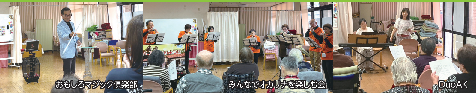
おもしろマジック倶楽部

デイサービスでのパフォーマンスありがとうございました!これからもふれあいセンターももをよろしくお願いたします。 中央区在宅デイサービスセンターのご利用は令和8年2月末で終了しました。