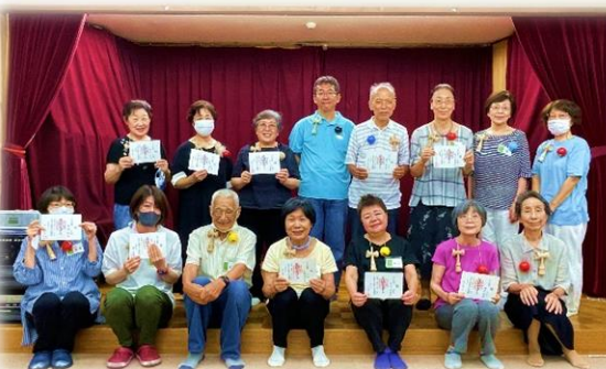
8/3 けん玉教室・検定会