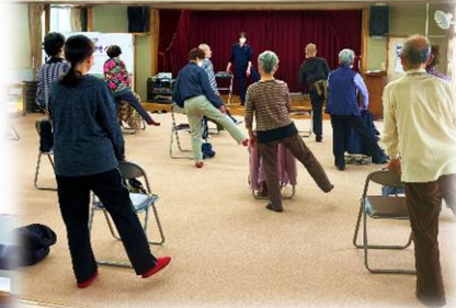
4/11 ゆっくりゆっくり シニアエクササイズ