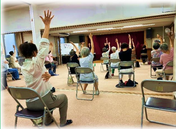
7/10 すこやかマッサージ&ダンス