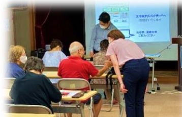
8/31 スマートフォン体験教室