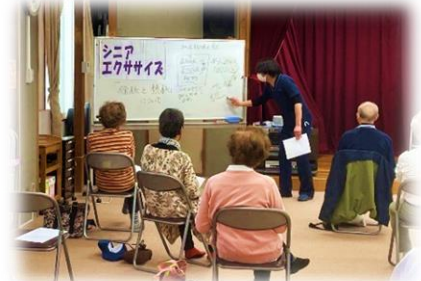
5/9 ゆっくりゆっくり シニアエクササイズ

「歴史・健康ウォーキング」の参加者の方が、レポートを作成してくださいました。あなたも平野郷を街歩きしたような気分になれますよ。お手に取ってご覧ください。