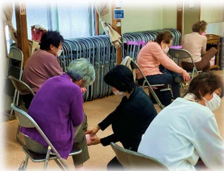
5/8 背骨コンディショニング体操