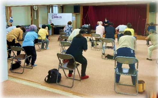
6/13 ゆっくりゆっくり シニアエクササイズ