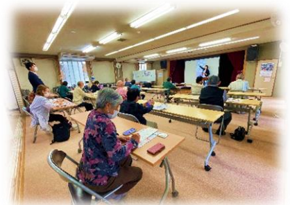
4/20 スマートフォン体験教室

●細かいことをするのが好きで、グラスアートはすごく楽しかった。●かわいい置物が作れて大変満足です。また参加したいです。●老人福祉センターのイベントに初めて参加した。お隣の方と楽しく作品作りができて良かった。