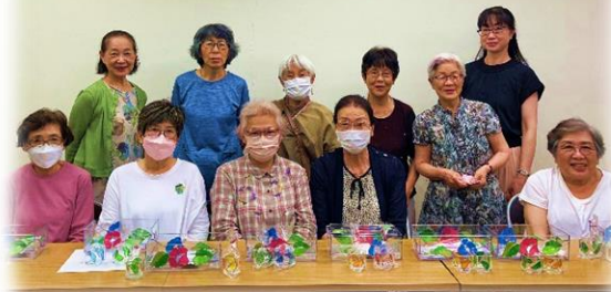
7/21 グラスアート教室③

●毎回、先生のお話しが楽しいです。次も参加したいです。●マッサージをすると、指先がポカポカして気持ちいいです。●最後にみんなでダンスをするのが楽しいです。