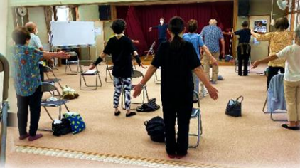
7/11 ゆっくりゆっくり シニアエクササイズ