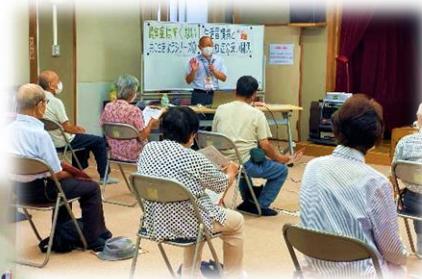
7/20 認知症は怖くない! 共に生きようシリーズ