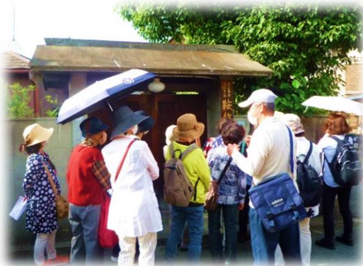
5/26 健康・歴史ウォーキング