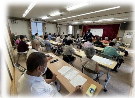
9/5 ペン字教室(4回コース)

●専門用語が使われなかったのが、わかりやすかった。●最後、質疑応答の時間があって質問することができた。丁寧に説明をしていただいたのが良かった。