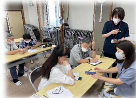
9/29 スマホなんでも相談会