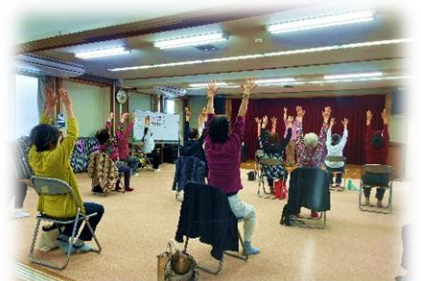
4/10 すこやかマッサージ&ダンス