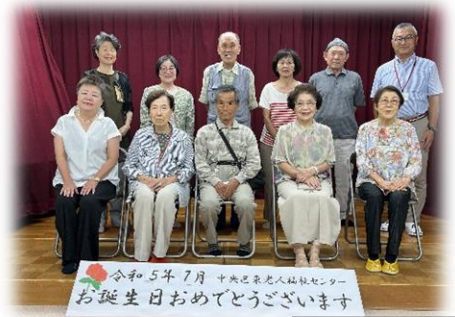
9/28 お誕生会・落語会