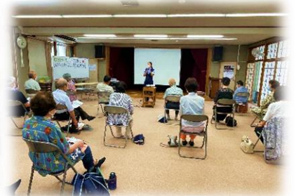
6/13 交通安全・ 特殊詐欺被害防止教室