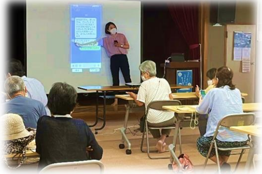
6/27 スマートフォン体験教室