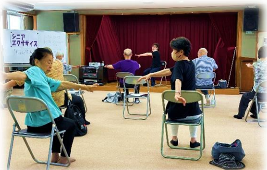
8/8 ゆっくりゆっくり シニアエクササイズ