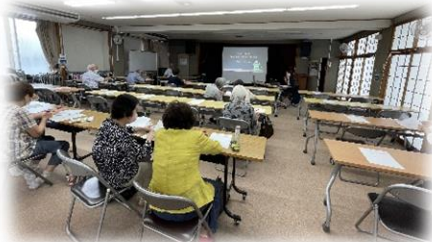
9/26 文化祭実行委員会