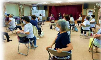
8/8 背骨コンディショニング教室