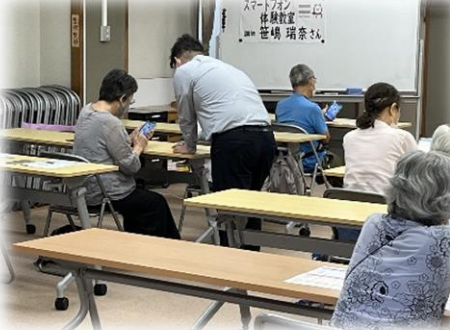
9/21 スマートフォン体験教室