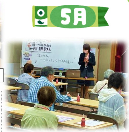
5/30 健康セミナー ①

5/18(木) 午後2時～ 講師:中央区北部地域包括支援センター・ 中央区オレンジチーム ●介護保険のことがよくわかった。●コグニ サイズが難しかったが、楽しかった。もっと、体 操をしてほしい。