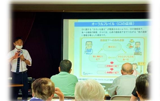
8/22 健康講座(歯科医による歯の話)