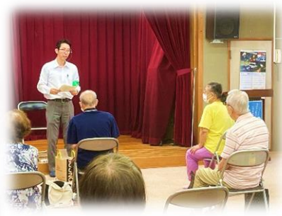
6/13 特殊詐欺被害防止教室