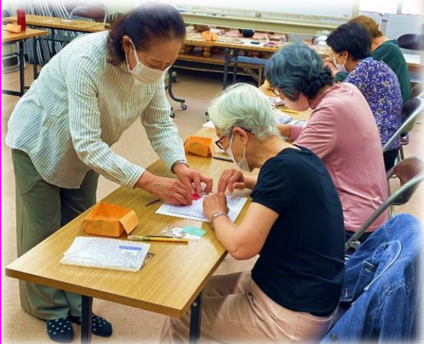
4/21 グラスアート教室