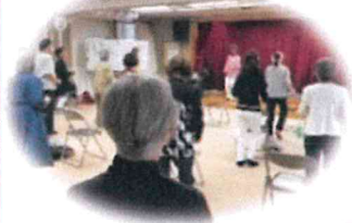
4/11 すこやかマッサージ &ダンス