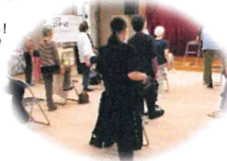
6/14 ゆっくりゆくり シニアエクササイズ③