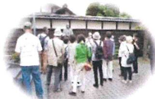
5/11 歴史健康ウォーキング