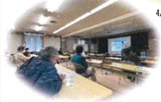
4/27 スマートフォン体操講座