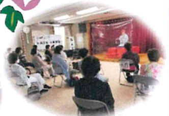
6/23 4・5・6生まれ お誕生会&落語会