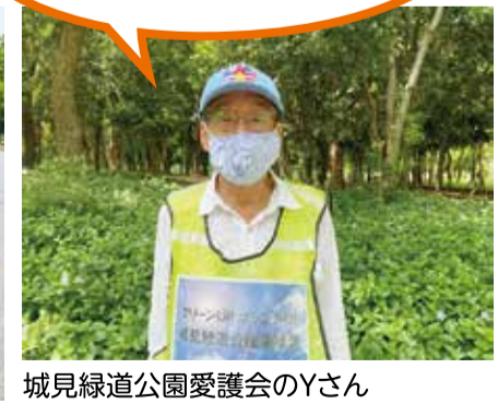
城見緑道公園愛護会のYさん