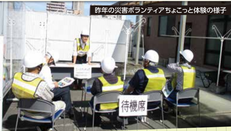
昨年の災害ボランティアちょこっと体験の様子