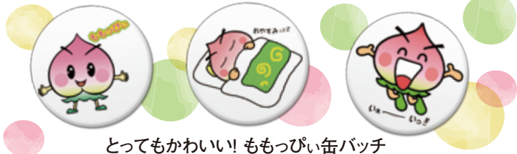
とってもかわいい! ももっぴい缶バッジ