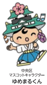
中央区 マスコットキャラクター ゆめまるくん

内容 第1部 講演会 「ちがい」を豊かさに 多文化共生の学校へ街へ ～子どもも大人も多文化共生～