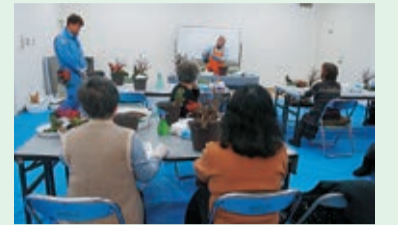
松竹梅の寄せ植え