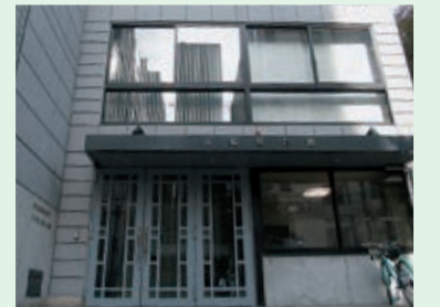
南船場会館(南船場3-7-12)

住民は少ないですが、お一人お一人とふれあい、コミュニケーションを大切に、芦池地域に住んで良かった、地域の活動に参加して良かったと思っていただけるよう、明るく楽しく安心して安全に暮らせるまちづくりを目指していききたいと思います。