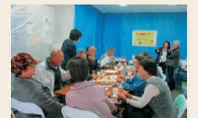
男性の参加も多く見られます

普段は、同じ場所でも月・木曜日の14:00～17:00に地域の交流の場「立ち寄りどころ てる」として居場所づくりをしています。(主催:南大江社会福祉協議会)