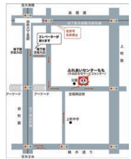
※駐車場はありません。