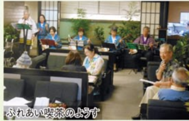
ふれあい喫茶の様子

また、ふれあい喫茶や高齢者の食事サービス(配食)もご好評を得ており、少しずつ参加者が増えています。