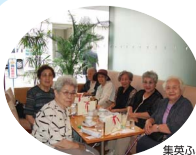
集英ふれあいミニ喫茶「井戸端会」