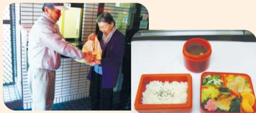
ふれあいセンター ももの手作り弁当

食事の調理が困難な方や、買い物に行けないおおむね65歳以上のひとり暮らし、ご夫婦だけの世帯を対象に見守りを兼ねてお弁当をお届けしています。