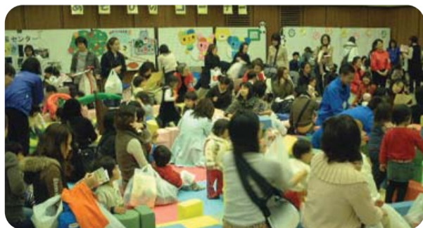
「親子であそぼう!わくわくまつり」のようす

平成21年3月には「ふくしわくわくフェスタ～子どもおとなもみんなおいでよ～」に実行委員会に参加、高齢者と子育て世代の交流も行いました。