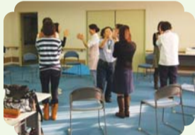
昨年の講座の様子「手遊びを学ぶ」

日 程 ：平成22年10月28日(木)～平成22年11月25日(木) 毎週木曜日 全5回 時 間 ：14時30分～16時30分 ※内容によって時間変更の場合あり 主 催 ：大阪府中央区社会福祉協議会 中央区子ども・子育てプラザ 大阪市立中央子育て支援センター 問い合わせ ：大阪府中央区社会福祉協議会 ふれあいセンターもも 電 話 ：06-6763-8139 (担当：西川)