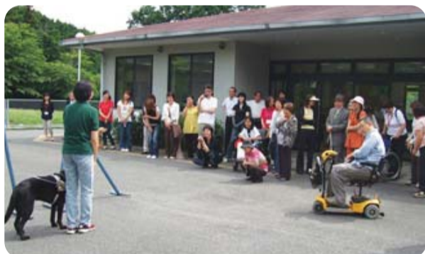
日本ライトハウス行動訓練所の見学のようす

保健・医療・福祉ネットワーク推進員さんと、HANDSちゅうおうのメンバー31名で、平成20年6月24日に千早赤阪村にある日本ライトハウス行動訓練所（盲導犬訓練部）へ見学に行ってきました。指導員の方から視覚障がいについての基礎知識や盲導犬の生い立ち、現状について説明をしてもらいました。参加者からは「すごく勉強になった!」「これをきっかけに地域の方と施設が仲良くなり、一緒になにかできれば」といった声があがりました。