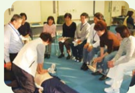
昨年の講座の様子「救急救命講習会」