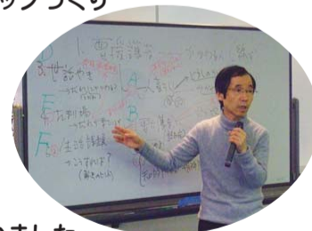
木原先生による講習の様子