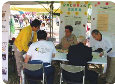
平成18年度区民まつりでの意見交換の様子

※CFK（中央区フィランソロピー懇談会）は、地域に根ざした企業の社会貢献活動について考えることを目的とした企業や団体の集まりです。アクションプランには策定時の作業部会から参加されています。