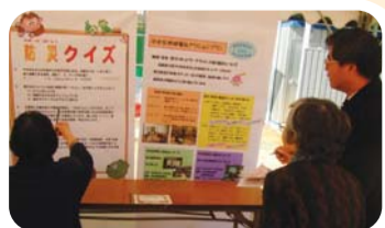
東平地域で実施した防災クイズの様子