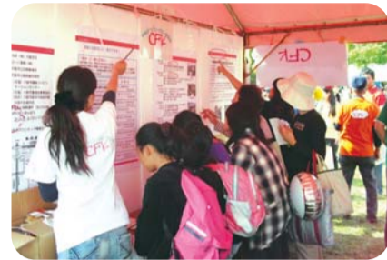
平成21年度区民まつりの様子