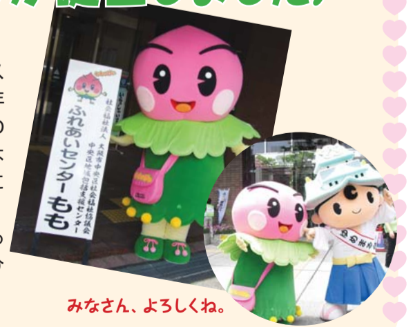
みなさん、よろしくね。

今後は区社協イベントにたくさん登場する予定です。「ももっぴい」を見かけたら、ぜひかわいがってくださいね!