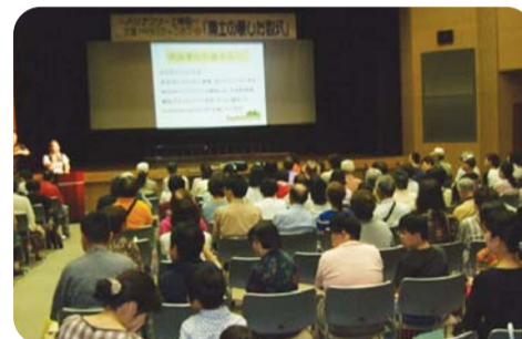
バリアフリー上映会では地上デジタル放送についての説明も行われました

また、会場を利用して地域の施設・団体の作品販売、物品紹介ブースが設置され、たくさんの方々とふれあう機会がもてました。