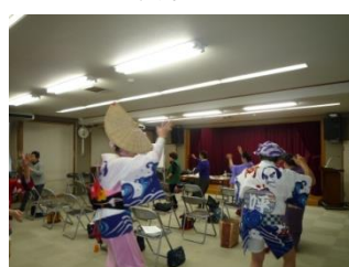
みんなで楽しく踊りました。