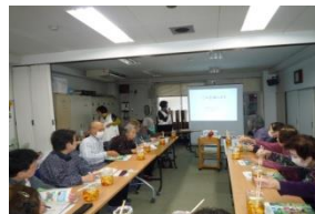
玉ねぎの皮で染めてエコバッグを作りました