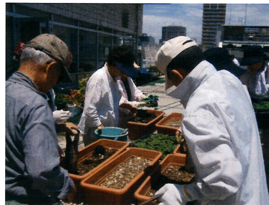
プランターに移植 しました