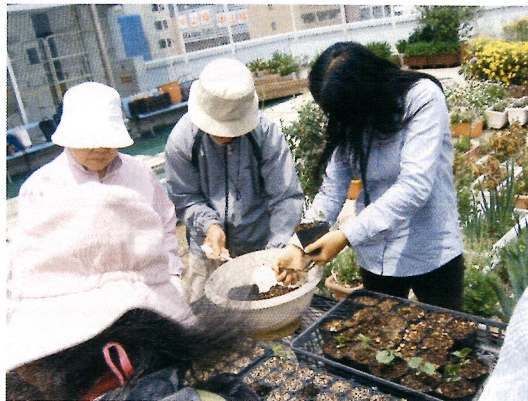
種から育てました

【問い合わせ】 大阪市中央区社会福祉協議会 中央区ボランティアビューロー 電話:6763-8139 FAX:6763-8151 住所:中央区上本町西2-5-25