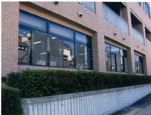
グリーン カーテン になりました