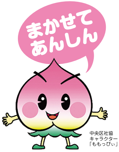
中央区社協 キャラクター 「ももっぴい」

まかせてあんしんMAPは 大阪市中央区社協のホームページから ダウンロード可能です。