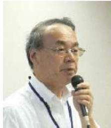
座長:高見中央区長